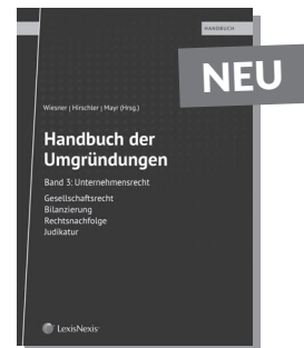
Band 3 – Unternehmensrecht, Gesellschaftsrecht, Bilanzierung, Rechtsnachfolge, Judikatur

Preis € 136,- | Wien 2018 | 868 Seiten Best.-Nr. 30145001 ISBN 978-3-7007-7150-0