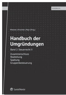
Band 2: Steuerrecht II Zusammenschluss, Realteilung, Spaltung, Gruppenbesteuerung

Preis € 168,- | Wien 2018 | 1.072 Seiten Best.-Nr. 30124001 ISBN 978-3-7007-6479-3